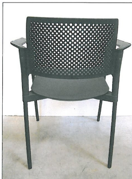
Vista da dietro