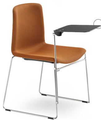
894/TT EN: Optional turning tablet IT: Tavoletta girevole opzionale